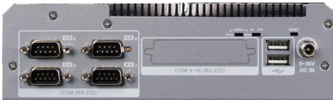
Izgled zadnje strane