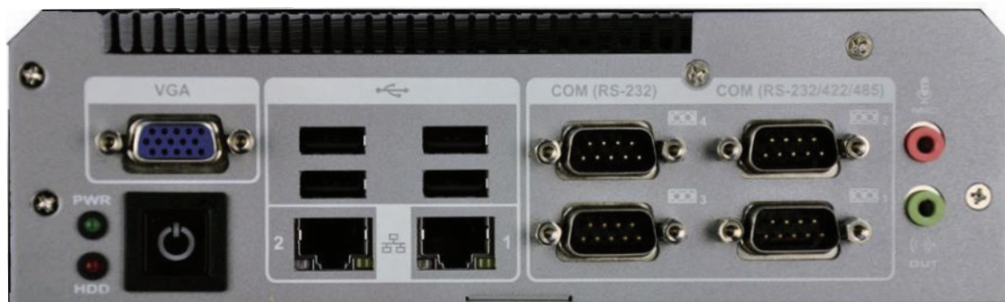
Izgled prednje strane